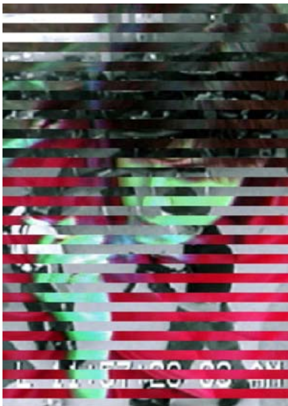
Afbeelding van het thema Media & Privacy, een van de zeven thema's uit het project MediaCultuur .

“De hedendaagse beeldende kunst kan een belangrijke bijdrage aan media-educatie leveren, omdat de media daar het spannendst worden becommentarieerd”, vindt Heijnen. Hij noemt het voorbeeld van de video-installatie Raw Footage van kunstenaar Aernout Mik. Deze selecteerde hiervoor ongebruikte archiefbeelden van de oorlog in voormalig Joegoslavië. Deze beeldenreeks toont bijvoorbeeld een prachtig heuvellandschap dat zich langzaam vult met grijze wolken, veroorzaakt door explosies en hevige vuregevechten die zich daar klaarblijkelijk afspelen. Er is geen geschreeuw, geen alarm. We zien mannen zich vervelen, een sigaretje roken of een cola drinken tussen het schieten door vanuit de loopgraven. Emoties blijven achterwege in Raw Footage . Zoals ook een commentaarstem of een verhaallijn, die de toeschouwer van deze video-installatie helpen de beelden te kunnen plaatsten. Heijnen: “ Raw Footage laat zo’n ander beeld zien van oorlog, de verveling, de spelende kinderen, de natuur. Beelden die we via de verslaggevers niet te zien krijgen maar die óók bij oorlog horen. Aan de hand van dit soort werken kun je prachtige lessen en opdrachten maken. Dit is wat we in MediaCultuur doen.”