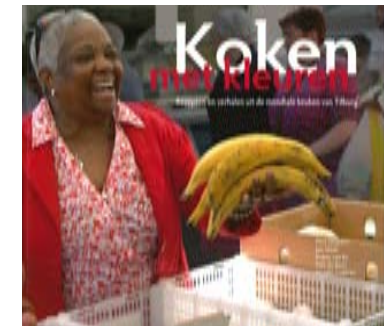
Kookboek Koken met kleuren .

Huisman: “Het leuke was dat studenten er echt voor op pad moesten. In eerste instantie vonden ze dat niks, maar de meesten kwamen met heel enthousiaste verhalen terug. Soms móesten ze gewoon blijven eten en stonden ze drie uur later pas weer buiten.