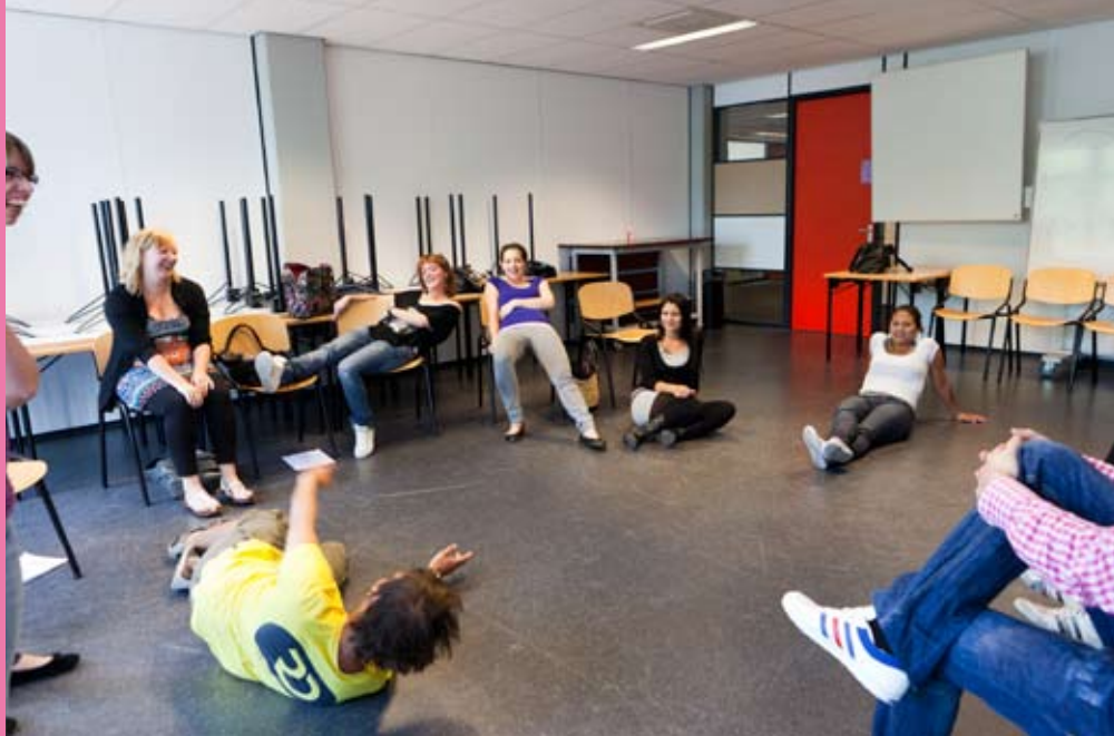
Studenten van de Fontys Leraren Opleiding Tilburg tijdens de dramasles.

Fontys Leraren Opleiding Tilburg (FLOT) verzorgt tweedegraads lerarenopleidingen en master lerarenopleidingen algemene vakken vo/bve in voltijd- en deeltijdtrajecten. Er zijn in totaal 17 bacheloropleidingen, bijvoorbeeld Nederlands, Frans en Duits, maar ook Wiskunde, Aardrijkskunde, Biologie, Bedrijfseconomie en Algemene economie. De opleidingen van FLOT zijn opgedeeld in zeven teams. Zo is er bijvoorbeeld het