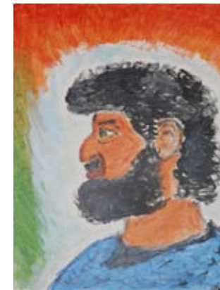
Schilderijen, gemaakt door studenten van FLOT tijdens een workshop op de jaarlijkse Cultuurdag.