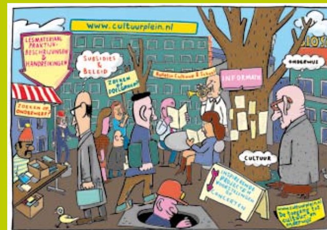
(illustratie: Jeroen de Leijer)