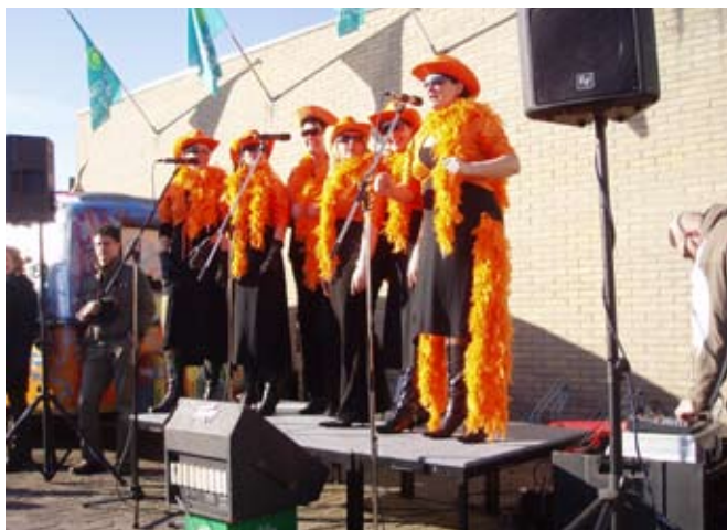
Ouders en leerkrachten van obs Apollo zingen een openingslied tijdens de festiviteiten rond Een kruiwagen vol Krakeel (2008).