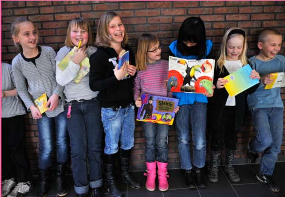
Leerlingen van obs Apollo.

Openbare basisschool Apollo staat in Krakeel, een arbeiderswijk uit de jaren '60 in Hoozeveen. De school bestaat 46 jaar en was het eerste gebouw in de wijk. Sinds augustus 2009 zit de school samen met christelijke basisschool De Morgenster in één nieuw gebouw, waarin onder meer ook de peuterspeelzaal, de BSO, het wijkcentrum en sportzalen zitten. De scholen vormen samen een brede school.