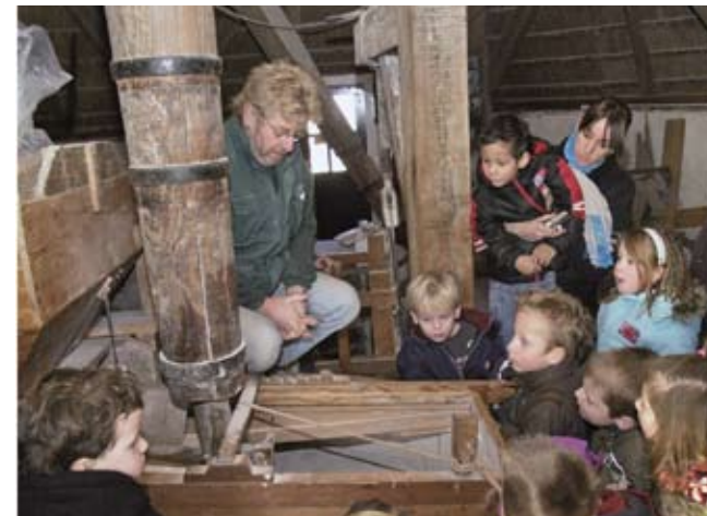
Kinderen op bezoek bij de molenaar in het kader van het project Molenmuis .

Taal en erfgoed gaan ook mooi samen in het binnen Kruiwagen ontwikkelde prentenboek-project De Molenmuis . De Apolloschool heeft dit als pilotschool samen met de openbare bibliotheek ontwikkeld. De bibliotheek liet tekenaar Tjibbe Veldkamp en schrijver Hans Sprij op basis van negentiende-eeuwse foto’s van de molen een verhaal maken over een muis die in de Hoogeveense molen woont. Samen met de school werden verwerkingslessen ontwikkeld, zoals het zelf maken van een boekje, een les over muizen en natuurlijk een uitstapje naar de molen. Het prentenboek is opgenomen in het gemeentelijke taalprogramma Knapzak vol taal . Scholen en de gemeentelijke Stichting