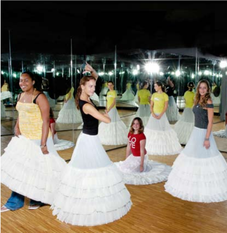
Jongeren in de Wonderkamer Silhouetten .

“Het hart van de tentoonstelling moest gericht zijn op kijken. Het moest zo worden dat je verlost wordt om te kijken, je móet gewoon kijken.”