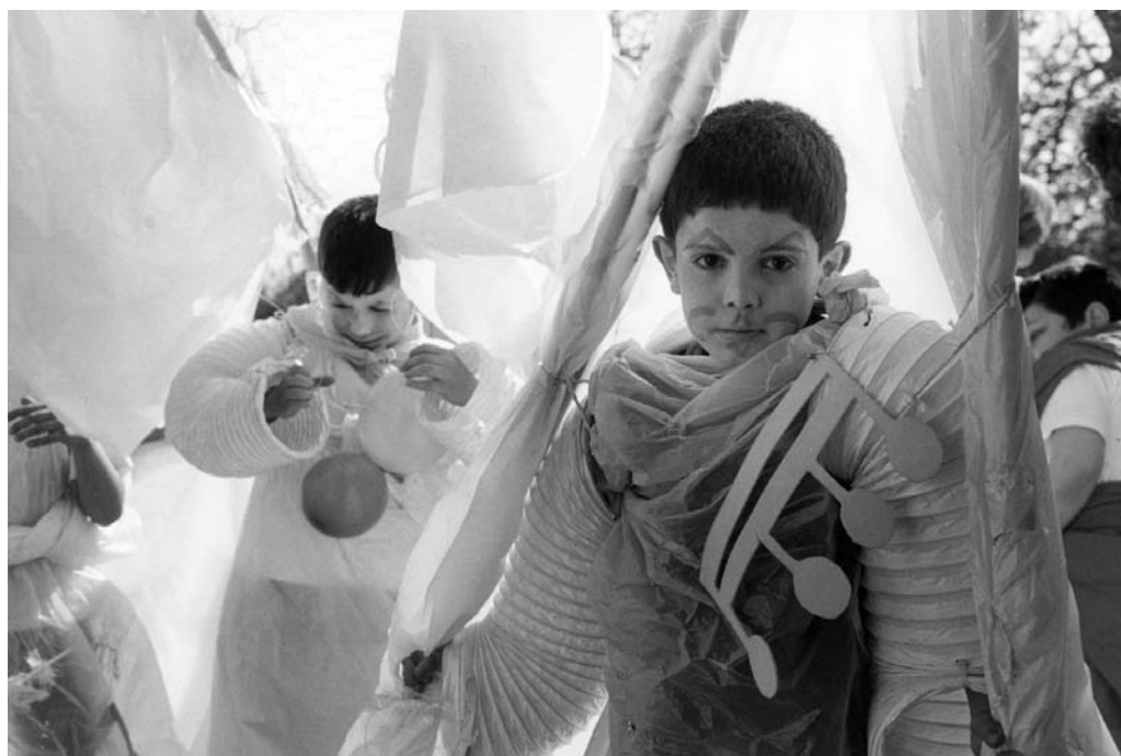
Project Deur op een kier . Leerlingen van de Wereldschool hebben zelf kostuums gemaakt rond het thema 'Vreemd en vreemd gedrag, zowel in jezelf als in de buurt'.