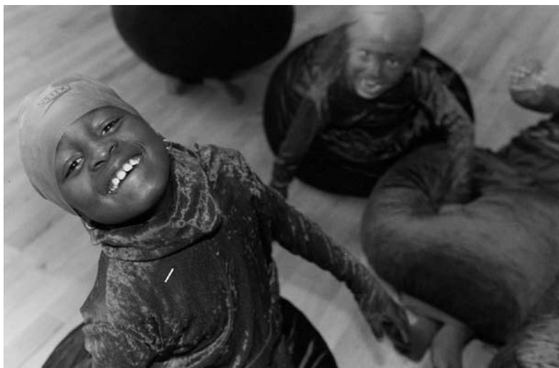
Project Deur op een kier . Leerlingen van de Wereldschool hebben een dans gemaakt van verhalen uit de buurt.

Vlaggen & Wimpels heeft de deelnemende scholen veel mooie dingen opgeleverd. Zo werd onder andere de cultuureducatie op een hoger plan getild, leidde het samenwerken tot meer samenhang in het docententeam, nam het leer- en leefplezier op de scholen toe, was er sprake van meer betrokkenheid van de buurt bij de school en van instroom van nieuwe leerlingen.