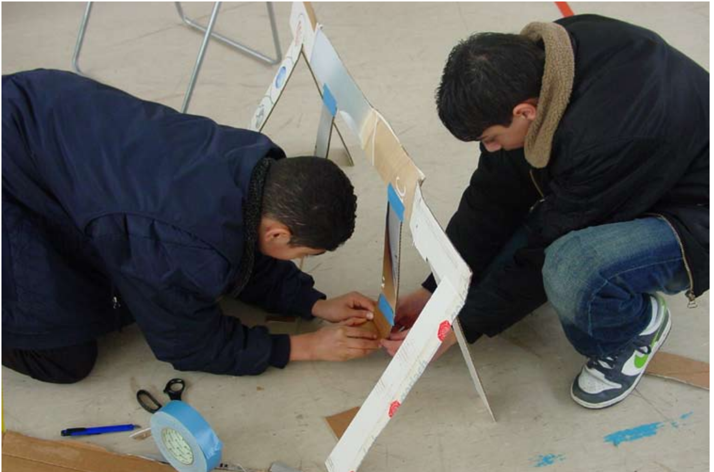
Leerlingen van het Calvijn met Junior College werken 'op schaal' bij het ontwerpen van het Staalmanpark.