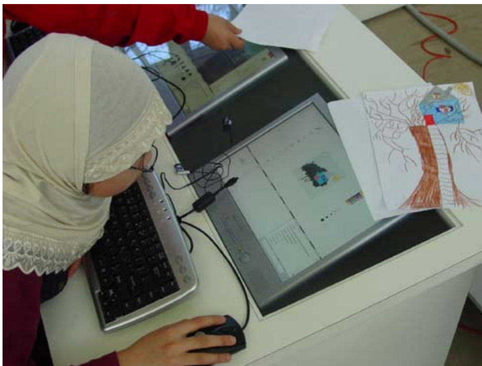
Leerling van het Calvijn met Junior College ontwerpt met behulp van de Interactor een 'Doeboom' voor het Staalmanpark.

uitvoering van de verschillende objecten voor het park, zoals het hekwerk en het kunstwerk De Staalman. Het Stedelijk Lab wordt ingericht als Stedelijke Werkplaats waar jongeren werkervaring kunnen opdoen. Zeven leerlingen van het Calvijn met Junior College hebben zich hiervoor aangemeld.